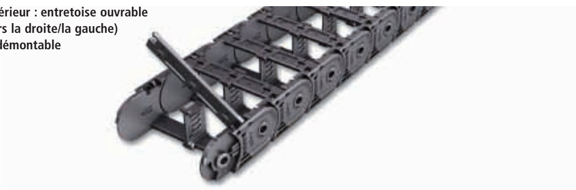
Dimensions en mm

■ extérieur : entretoise ouvrable (vers la droite/la gauche) et démontable