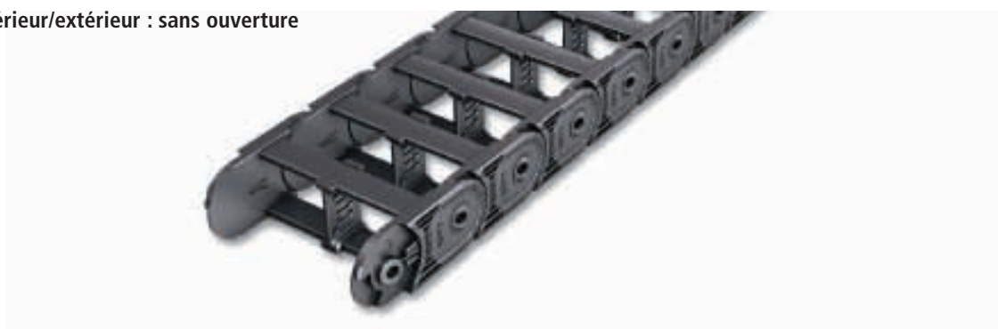
Dimensions en mm